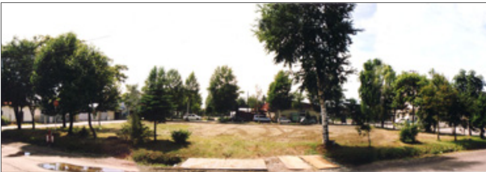
再整備前のやよい児童公園

施設が老朽化している公園や市民のニーズに対応できていない公園などについて、施設の老朽化状況や安全性、利用の頻度、地域の要望、緊急性などに応じ、計画的に改修をすすめます。この際、地域住民が中心となった公園づくりをすすめます。