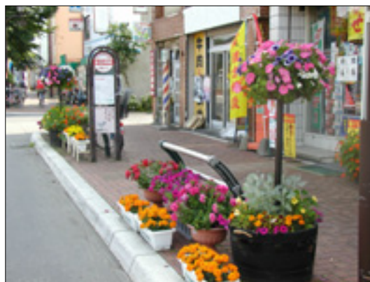
歩道上にさまざまな花を配置した緑ヶ丘商店街

買い物客や行き交う人々に、四季を彩る花やさまざまな緑を提供し、人々が潤い・集い・賑わいのある商店街の形成をすすめます。