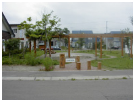
西交友ポケット広場

市街地に点在している小規模な公園用地は、地域のコミュニティーの場などさまざまな地域活動の場として、地域住民が主体的に活用できるように取り組みをすすめます。