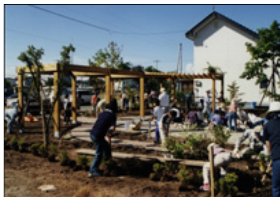
市民中心の緑づくり

公園の整備や花づくりなどいろいろな緑づくりにおいては、ワークショップ方式などを活用し、市民が中心となった緑づくりをすすめます。