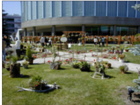
ふるさとと花コンクール

緑への理解を深め、緑づくりへの関わりを促すため、市民のアイデアなどを募りながら、多くの人々が気軽に参加できる緑のイベントを実施します。