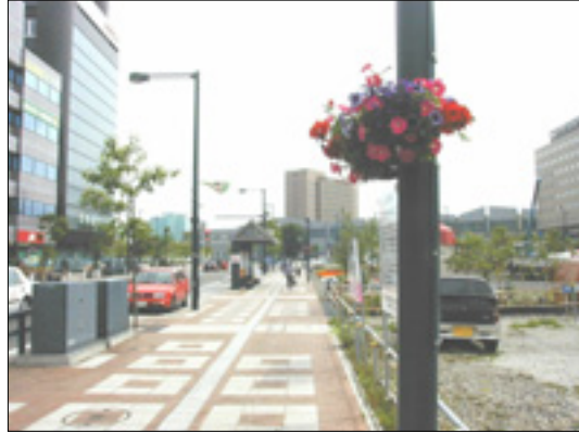
街路灯を利用した緑づくり

歩道にある電柱や街路灯などで、街路樹や植樹マスの緑と調和をはかりながら、ハンギング、つる性植物などにより高さのある緑づくりを検討します。