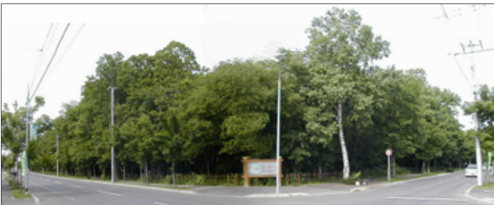
多くの自然を残した石王緑地

都市内に残されている貴重な樹林地は、動植物の生育・生息空間や市民のオアシスとして、周辺の土地利用状況などに配慮しながら、保全していきます。