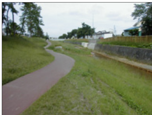
柏林台川の水辺の楽校

都市内の河川空間を活用し自然体験学習の場として配置された「水辺の楽校」について、関係団体などと協力し、有効な活用につとめます。