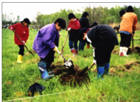
帯広の森市民植樹祭

帯広の森の植樹祭や育樹祭などにより培われた市民による森づくりや並木づくりなどの活動を引き継ぎ、さまざまな植樹や育樹の活動をすすめます。