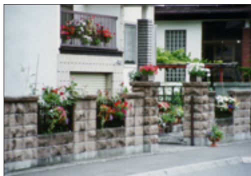
塀、バルコニーを活用した緑づくり

花壇やプランター、ハンギングバスケットなどを利用し、彩り豊かな花づくりをすすめ、潤いのある生活空間やきれいな地域づくりをすすめます。