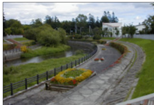
帯広川の空間を利用した花壇

河川の水辺環境や自然環境を保全しつつ、河川景観との調和をはかりながら、堤防面や河川内に水辺の花づくりをすすめます。