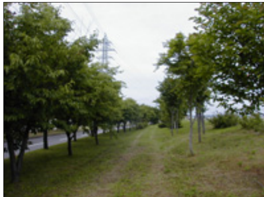
札内川の河川並木

風の道をつくり、四季を感じるきれいな街並みを形成し、小動物の生息・生育や移動空間、市民が憩う水辺の空間など人と環境にやさしい河川並木の形成をすすめます。