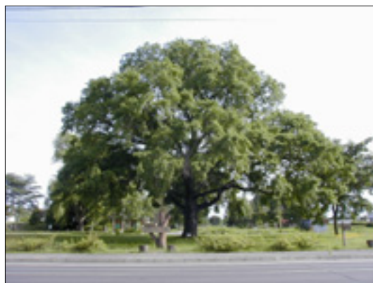
市の保存樹木に指定されている 推定樹齢200年以上のハルニシ

地域のシンボルとして残されてきた名木や巨木、歴史を刻んできた古木などを大切に保全し、次世代につないでいきます。