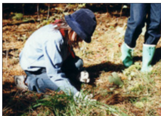
どんぐりの植え込み

帯広の森は、緑づくりの場、スポーツ・レクリエーション、自然学習、休息・休養、自然とのふれあいなど緑の核として位置づけ、さまざまな環境づくりを行うとともに、帯広の森をフィールドとした環境学習などの利活用について検討していきます。