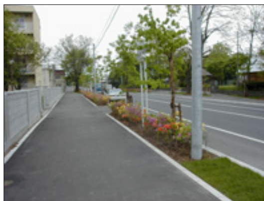
ミズナラとツツジを植栽した柏通

樹木の特徴を生かし周辺環境や景観に配慮しながら緑のつながりを確保し、帯広らしい街並みを形成するため、計画的に整備をすすめます。