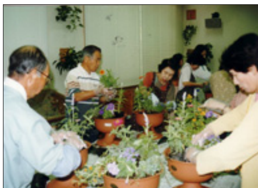
ガーデニングの講習会

緑に関する知識や技術の向上をはかり、緑にかかわる人の輪を広げるため、関係機関と連携しながら講習・研修などを実施し、人材の育成につとめます。