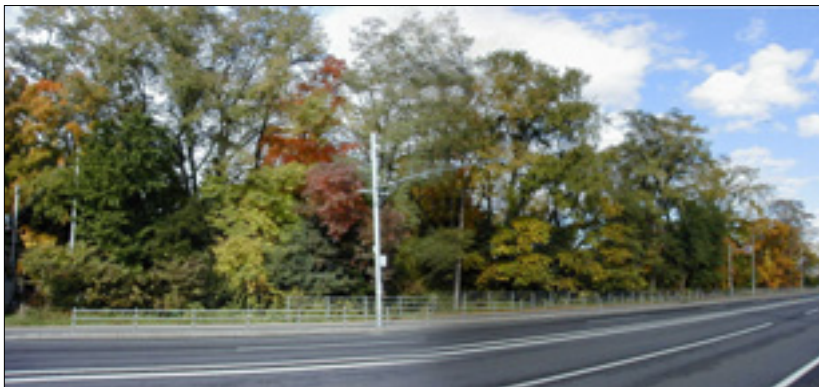
道環境緑地保護地区に指定され保護されている緑地（水光園）

都市内に残されている緑豊かな樹林地は、所有者の理解と協力を得ながら、法制度などを活用し、保全につとめます。