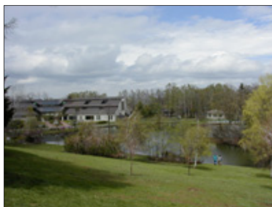
十勝池と百年記念館