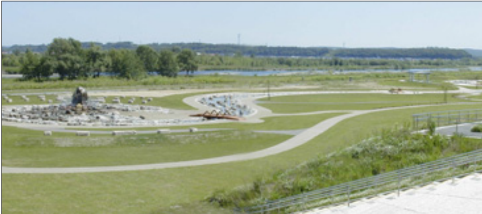
河川敷地を整備した十勝川水系緑地

十勝川水系緑地は、スポーツ・レクリエーション活動や水辺の空間として、楽しく安全に利用できるよう適正な維持につとめます。また、水辺や河畔に残されている自然環境は、関係機関と連携しながら保全していきます。