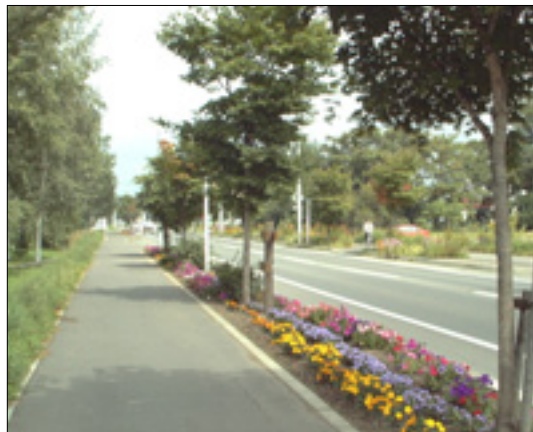
植樹マスに花を植えている道路

植樹マスや歩道空間を活用し、周辺の地域住民が協力し彩りのある花づくりをすすめ、歩いて楽しい花のネットワークをつくれます。