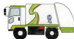
プレス パッカー車