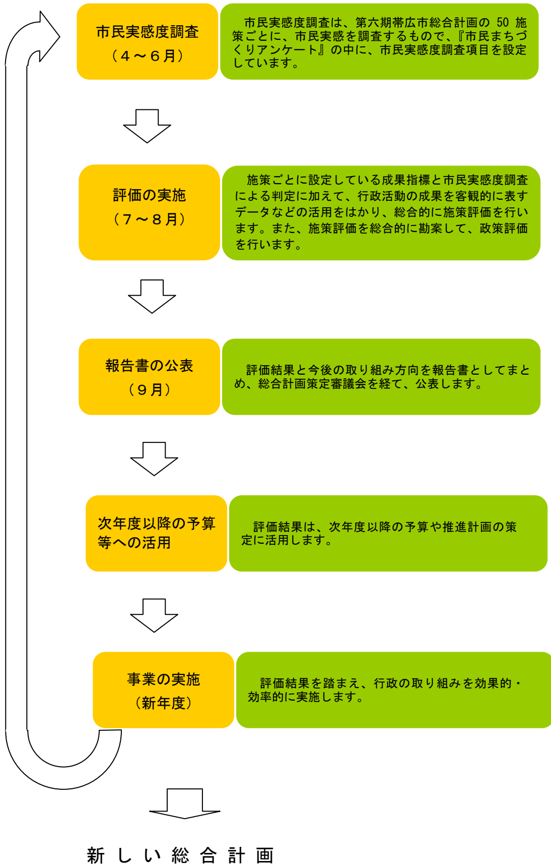
図3 第六期帯広市総合計画におけるPDCAサイクル