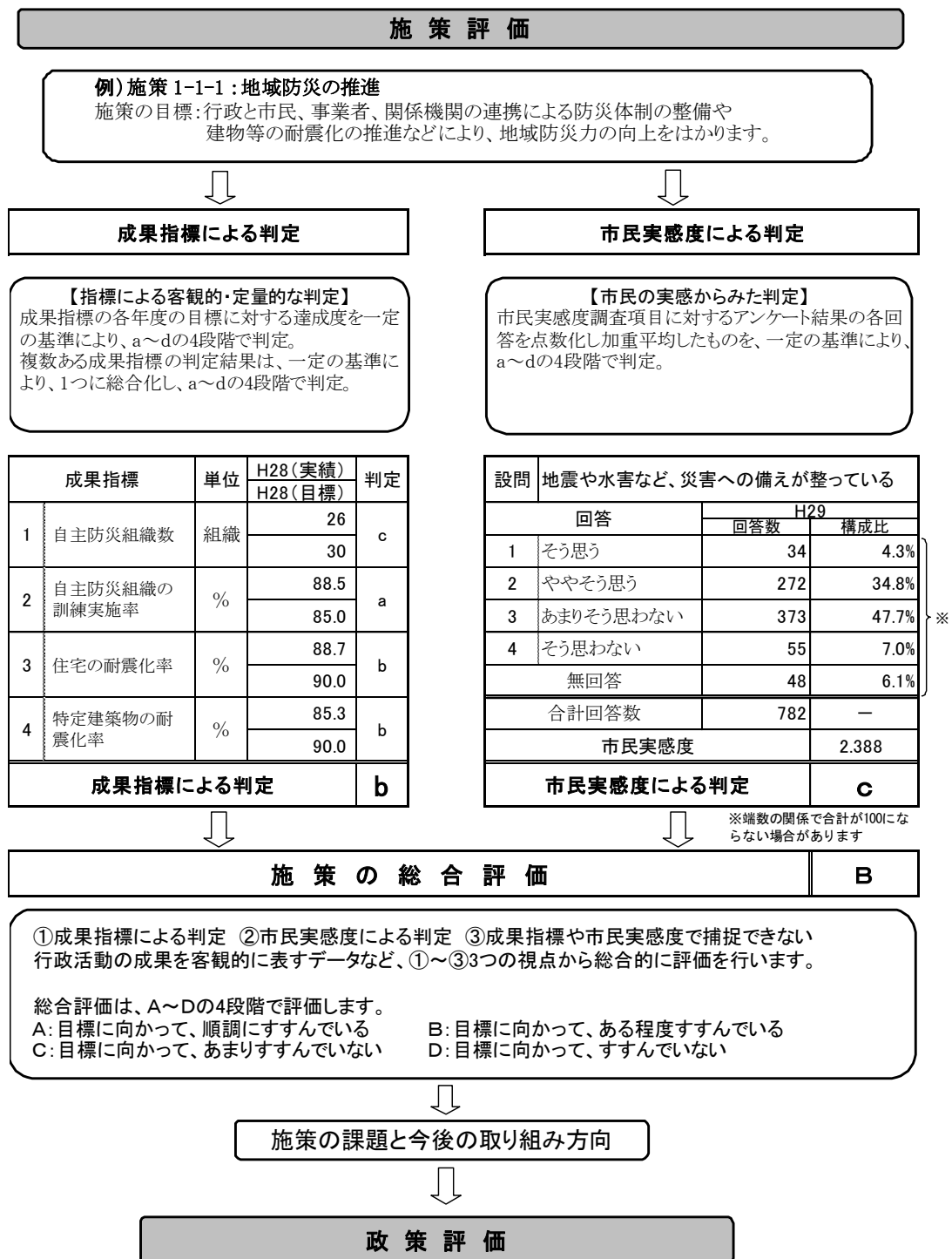
図4 政策・施策評価のしくみ