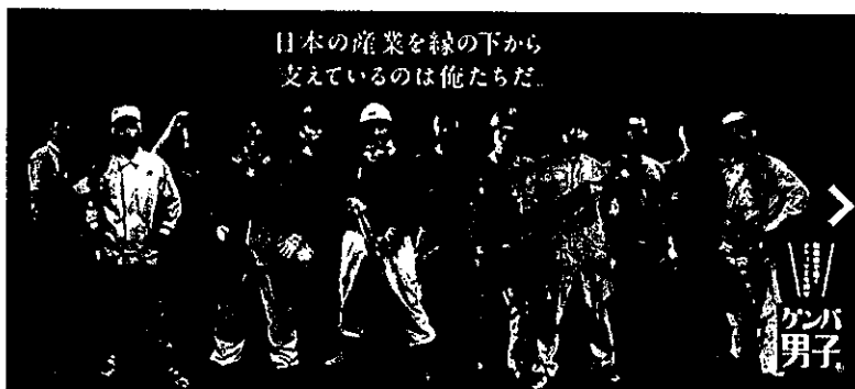
ゲンバ男子:大阪産業創造館 中小企業情報サイト