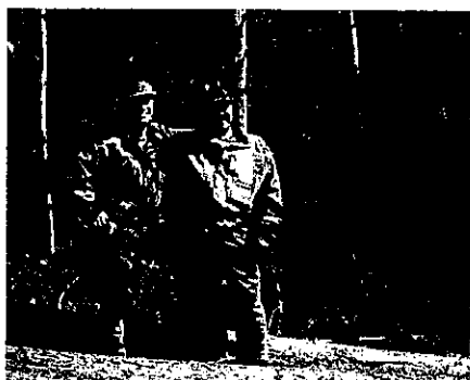
研修生はいま:「緑の雇用」ウェブサイト