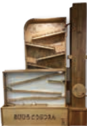
◀オリジナルの大型木製遊具