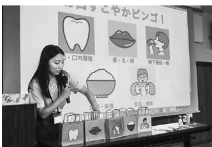
盛りあがったビンゴゲーム

学生の皆さんが主導となってゲームがすすめられました。町内会の新年会をはじめ交流会などで馴染みのあるビンゴゲームが元となっているため、楽しまれている方が多く、共通の話題が出ることで他の市町村の方とも話が弾んでいる様子で大いに盛り上がりました。