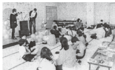
みんな静かに聞いています

小樽市赤岩町会では、本に触れる機会を作り、子どもたちに本の面白さを知ってもらおうとともに、その保護者にも町会の活動を身近に感じてもらうよう、赤岩文庫を立ち上げました。幼児から小学校6年生の児童が参加し、普段読書をしていない子どもたちも静かに大型の絵本の読み聞かせを聞いていました。保護者からも好評で、参加した児童の保護者も手伝ってくれるなど相乗効果も出ています。