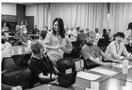
学生の皆さんがゲームの進行・サポートをしてくれました