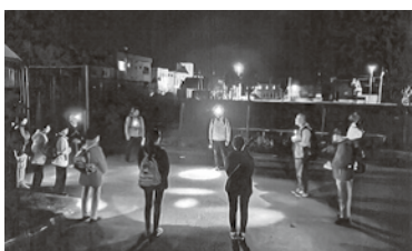
夜間の避難は危険度が増します

倶知安町新東和会では、夜間に地震発生した場合に備え夜間の避難訓練を実施しました。避難場所や手順の確認し、近所で声をかけ合いながら慎重に行いました。昼間との違い夜間の避難は危険が伴うことが確認できたほか、照明器具など各自で備える必要な備品なども知ることでできました。