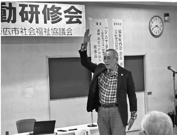
▲地域福祉活動研修会