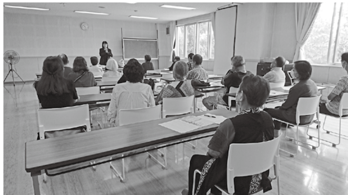
▲防災研修会の様子 女性も多く参加されています！

A. 加入率の低下の原因は、昔は人との交流が凄く楽しかったけど、現代はほかに楽しいことがありすぎるからなのでは、と個人的には思います。ただ、そんな中でも「人のつながりを絶やさない」ことは重要だと思います。また、2018年のブラックアウトのときには町内会がやっぱり必要だ！と思いましたね。防災というのは重要な要素だと思います。