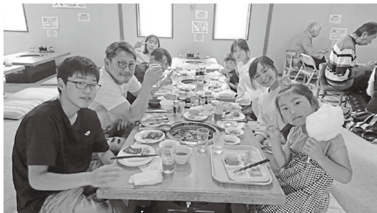
▲親睦会の様子 多世代の参加が印象的！

A. まずは町内会の活動を知ってもらうことが大事だと思っています。そのために、町内会だよりを未加入世帯にも配布して、町内会活動を周知しています。次に、参加のハードルを下げる工夫をすること。たとえば、「子連れでも来やすい場」の準備。子どものためのスペースや見守り役がいるだけでも、子育て世代は参加しやすくなりますよ。