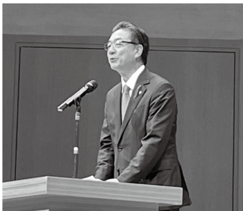
▲開催市挨拶をする米沢市長