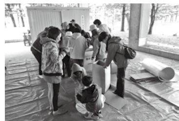
【段ボールベッド作り体験】