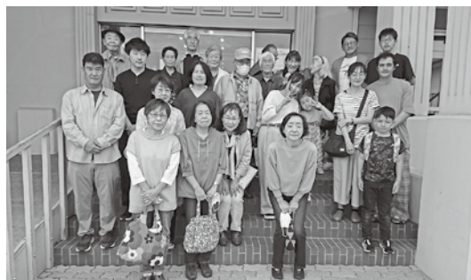
▲せせらぎ町内会のみなさん

A. 臆せず挑戦してほしいです。普段の小さな気づきを、町内会で行動に変えてほしいと思います。色々な活動をしていく中で、視野が広がり、楽しく続けられることもあると思いますよ。