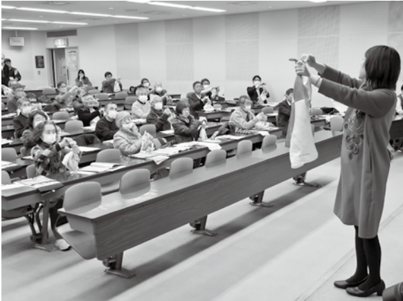
▲防災研修会の様子

広域連携事業により十勝管内の市町村居住者など53名が参加し、実際に手を動かしながら基本となる風呂敷の結び方や応用の結び方などを学びました。