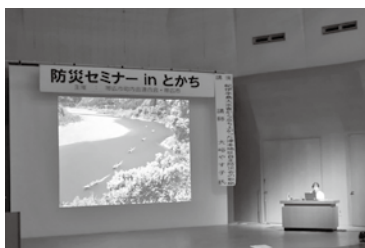
【防災セミナーinとかち】

帯広市町内会連合会および帯広市では市民の防災意識を高める取り組みとして防災セミナーや防災研修会を開催しています。セミナーや研修会で得た学びを、町内会で共有することも共助に繋がります。家族や友人・知人等を誘って、参加してみたいかがでしょうか。