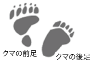
クマの前足 クマの後足 足跡