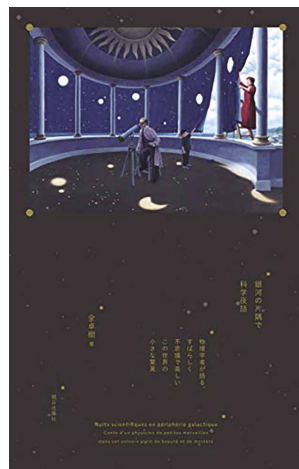
(表紙画像使用許諾済)

銀河の中心に存在する巨大なブラックホールの起源に迫る話や、思い出そうとしても消えていく夢に潜んだ記憶の話など、科学と文学があざやかに調和する、とっておきの22話で構成された短編集です。1日の終わりに、めくるめく不思議な科学の世界を楽しんでみませんか。