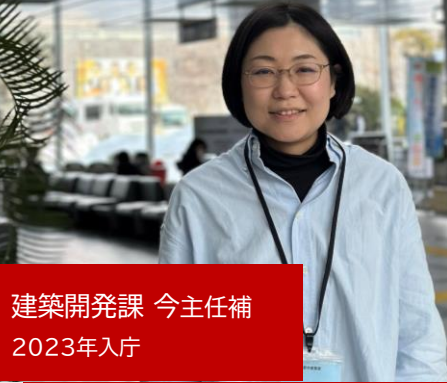
建築開発課 今主任補 2023年入庁