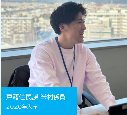
戸籍住民課 米村係員 2020年入庁