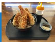
◀ 外勤時の昼食の楽しみ 「天丼」