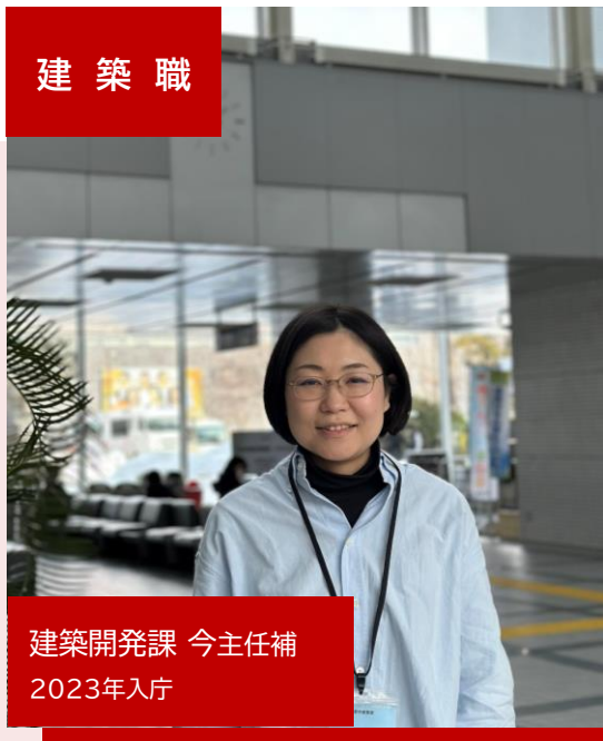
建築開発課 今主任補 2023年入庁