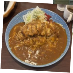
▲イチオシのアバッチカレー