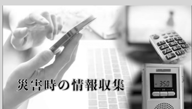
災害時の情報収集