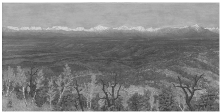
十勝大平原と日高連峰