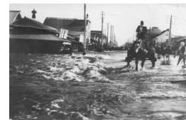
◀大正11年の洪水の際の西2南4付近