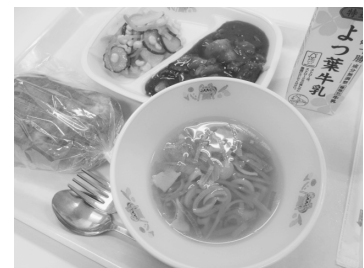
ふるさと給食の新メニュー（11月）