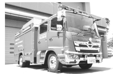
水槽付消防ポンプ自動車