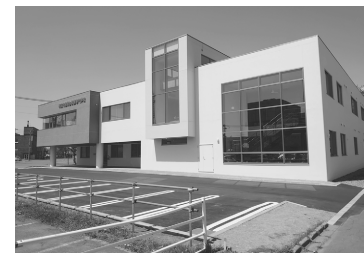
整備費を支援した医師会看護専門学校