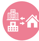
関係機関と 連携した支援