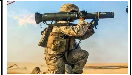
米陸軍：AT-4対戦車無反動砲等