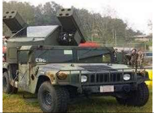
米陸軍：アベンジャー等（非実射）