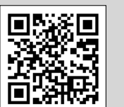
▲大会公式ホームページ

大会公式ホームページのほか、募集要項(払込用紙)による申し込みも可能です。市内のコミセン、福祉センター、体育施設、スポーツ課で配布しています。種目・参加料など詳細は、大会公式ホームページをご覧ください。