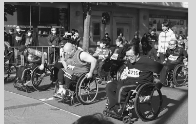
昨年のプレ開催の様子

対象 小学生以上の車いす常用者、およびそれに準じる人(18歳未満は保護者の同意が必要)