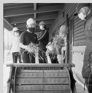
地域の人に学ぶ 小麦栽培

木をふんだんに使った温かみのある校舎と、地域と連携し、豊かな自然環境を生かした教育活動が特色です。小麦の栽培や、乗馬体験、氷の彫刻作りなどに、子どもたちが生き生きと取り組んでいます。