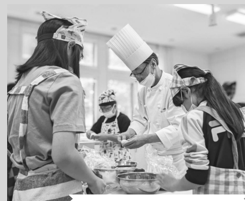
専門家から学ぶ食農教育