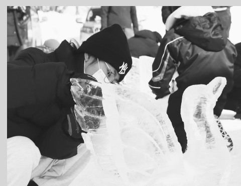
地域の講師に学ぶ 氷の彫刻作り

市長への手紙 まちづくりに皆さんの声を生かします。市政に関するご提言、ご意見などをお寄せください。