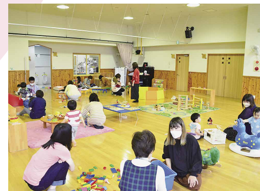
▲豊成保育所「あそびの広場」