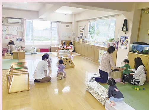
▲子育て支援センターすずらん