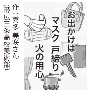
作：喜多美咲さん (帯広三条高校美術部)