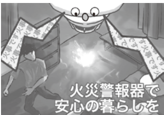
火災警報器で 安心の暮らしを