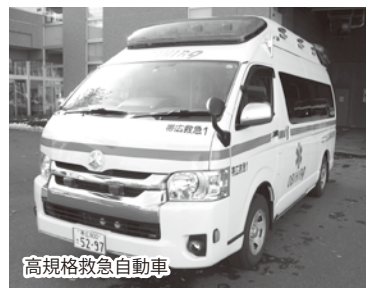
高規格救急自動車