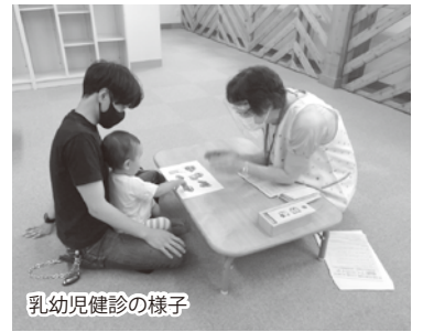
乳幼児健診の様子