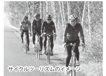
サイクルツーリズムのイメージ