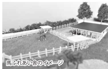
馬ふれあい舎のイメージ