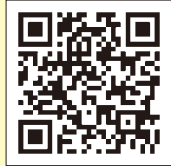
▲公式ホームページ

日時 10月29日(土)～11月2日(水)、9時～17時 会場 とかちプラザ（西4南13）