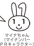
マイナちゃん(マイナンバーPRキャラクター)

電子マネーや二次元バーコード決済などの、対象となるキャッシュレス決済のサービスを決めて、スマートフォンのアプリから手続きをするよ。市役所や郵便局でもできるよ。9月30日までにマイナンバーカードを申請している人は、来年の2月末までにマイナポイントの手続きをしてね。