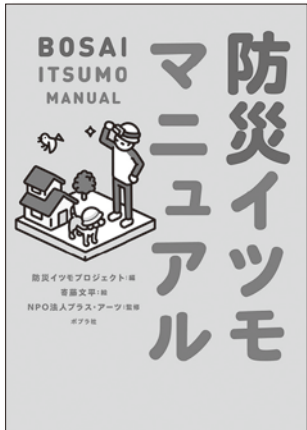
(表紙画像使用許諾済)

著者…防災イツモプロジェクト/編 寄藤 文平/絵 NPO法人プラス・アーツ/監修 出版社…ポプラ社