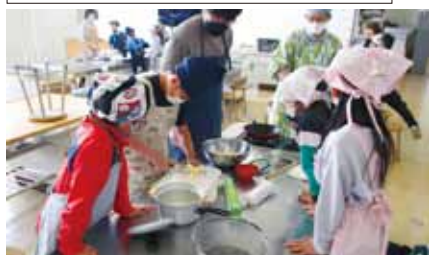
▲食育推進サポーターによるいも団子作りの様子