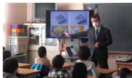
▲食育推進サポーターによる豆腐についての授業の様子