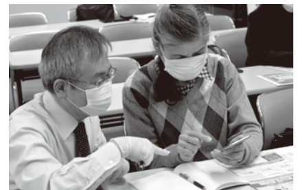
3月に開催した教室の様子

申問 6月6日(月)～17日(金)までに、電話でICT推進課(市庁舎9階、☎65・4118)へ。