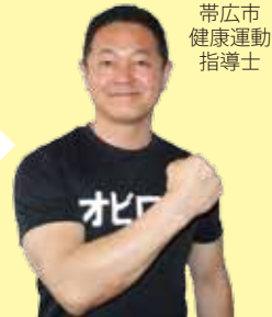
帯広市 健康運動 指導士