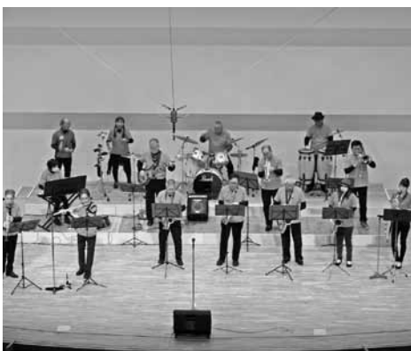
令和3年度「音の響演フェスティバル」の様子

おびひろ市民芸術祭は、十勝・帯広において文化活動を行っている団体や個人が、日頃の練習や創作の成果を発表するとともに、市民の皆さんに鑑賞いただくことを目的に、毎年市民文化ホール、とかちプラザ(西4南13)、市民ギャラリー(西2南12、帯広駅地下1階)で開催しています。 今年も、ステージ部門で36団体・495人、展示部門で21団体・293人の総勢788人が出演・出品予定です。 幅広い世代の参加者によるさまざまなジャンルのパフォーマンス