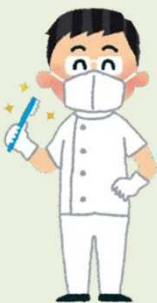
歯科医師 歯科衛生士