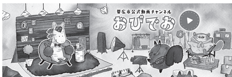
帯広市公式動画チャンネル