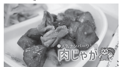
▲人気ミニ動画【動画施設見学】帯広市学校給食センターの秘密！肉じゃが編

3月の燃やさないごみ、有害ごみの収集日 燃やすごみが月・木曜日収集地区は、3月9日(水)、23日(水)です。燃やすごみが火・金曜日収集地区は、3月2日(水)、16日(水)、30日(水)です。 ☎清掃事業課（西24北4、☎37・2311）