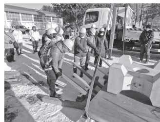
ガレキからの救助救出訓練

日時 2月5日(土)、13時30分～17時30分 場所 緑丘小学校(西14南17) 定員 【一般訓練】先着100人、【親子防災】抽選30人 申し込み 1月14日(金)までに、電話で危機対策課へ。