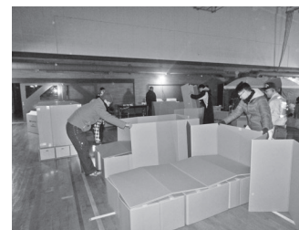
段ボールベッド設営体験