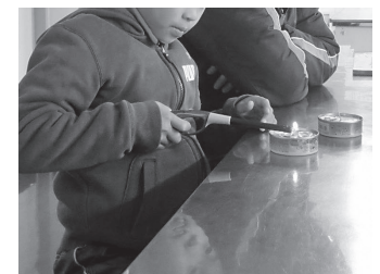
親子でランタン作り