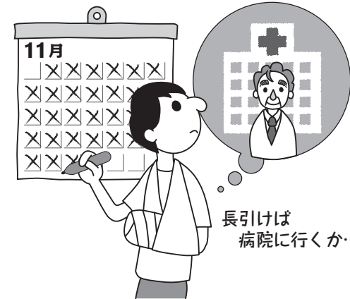
長引けば病院に行くか...

白紙の用紙に署名をしたり、印鑑を渡したりするのは、誤った請求につながる恐れがありますので注意してください。