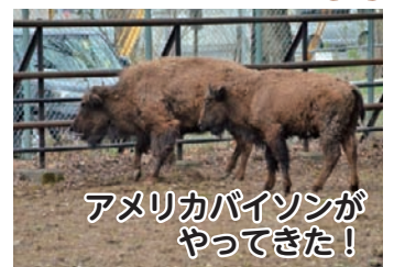
アメリカバイソンがやってきた!

この日は、以平連合町内会の子もたちや観光団体など約30人が参加し「おびひろ大すき☆」「コロナに負けるな!」「新型コロナが1日も早く収束しますように…」など書き込み、最後はみんな笑顔で記念撮影。メッセージが書き込まれた飛行機は、子どもたちの思いを乗せ、釧路湿原や摩周湖を巡る遊覧飛行へ飛び立ちました。(5月3日、とち帯広空港)