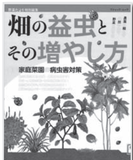
(表紙画像使用承諾済)