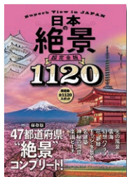
(表紙画像使用承諾済)

旅行に行きたいけど行きにくい…。そんな今のご時世にぴったりなのがこの本「日本の絶景超完全版1120」です。