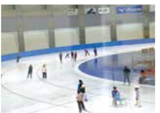
帯広の森運動公園