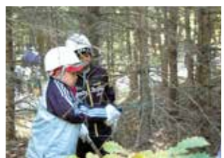
帯広の森・はぐくーむ