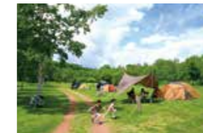
スノーピーク十勝ポロシリキャンプフィールド