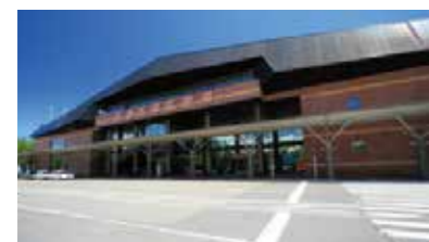
とちかち帯広空港

市街地から車で約30分の距離に「とちかち帯広空港」があり、羽田空港へは1日7往復運行しています。高速道路や鉄道が整備されているので札幌への日帰りも可能という、アクセスの良さもポイントです。