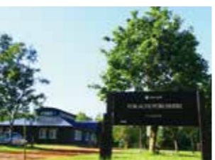
スノーピーク十勝ポロシリキャンプフィールド

市街地南西にある帯広の森。十勝特有の木々が植えられており、広い敷地内にはスピードスケート場や市民プールなど、運動施設も集まっています。都市と自然が調和した帯広市を象徴するスポットです。