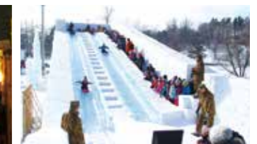
おびひろ氷まつり