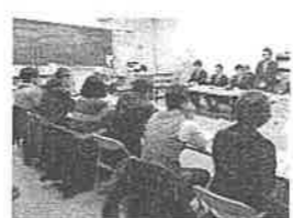
学校運営協議会の様子