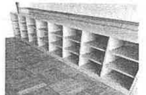
市内6中学校に整備したスクールロッカー