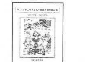
第四期帯広市子どもの読書活動推進計画の策定