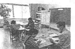
特別支援学級の授業の様子