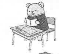
特別支援学級の授業の様子