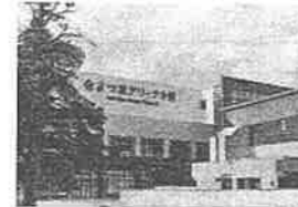
帯広市総合体育館(よつ葉アリーナ十勝)