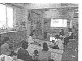
子育て講座の様子