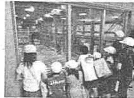
くりりんセンター見学の様子