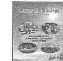
帯広市教育基本計画(令和2年度～令和11年度)の策定