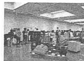
「十勝開拓日記」展示の様子