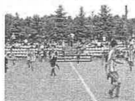
日本クラブユースサッカー選手権大会試合中の様子