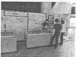
「マッチ箱展」展示の様子