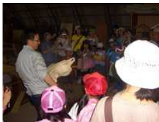
動物園で作成した標本も見させていただきました。