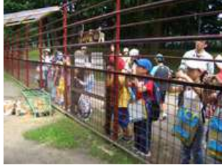
ヤギの様子もしっかり撮影