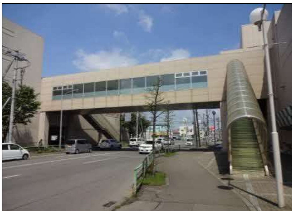
写真 1 西5条横断歩道橋