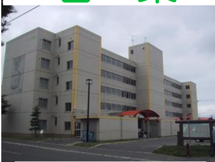
(間取りは、3LDKの一例です。)