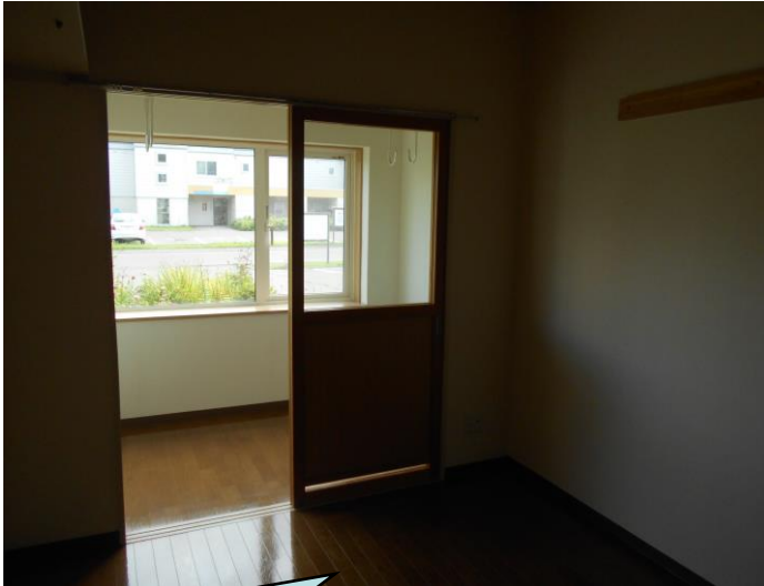
洋室からサンルームにかけて