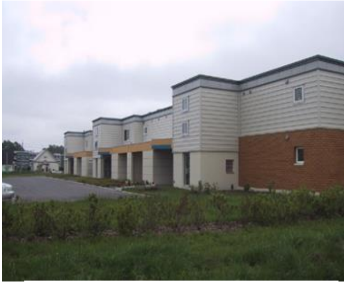
(間取りは、3LDKの一例です。)