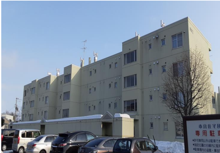
(間取りは、3LDKの一例です。)