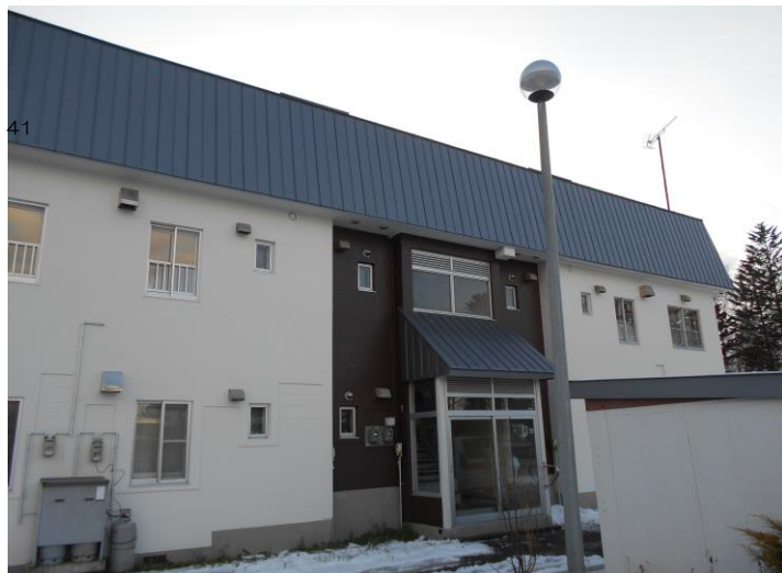
(間取りは、3LDKの一例です。)