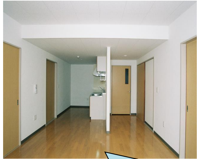
居間・食堂から台所にかけて