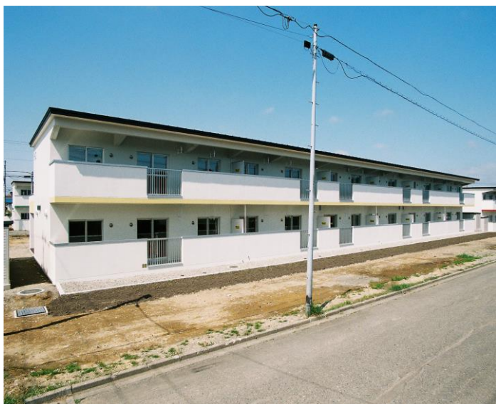
(間取りは、3LDKの一例です。)

家賃：¥16,600~35,300/月 駐車場：¥1,050~/月 (1台分用意あり) ※自治会費,機器リース料除く。 ※敷金：決定した家賃の2ヶ月分 ※家賃の金額は、世帯の収入に応じて こちらの金額から前後することがあります。