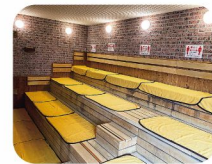
ひのきを使用した高温サウナ