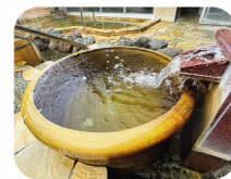
ぜいたくな気分を味わえる壺風呂

いろいろな湯船があり、どこに入ろうかな?と楽しくなります。露天ひのき風呂はとっても良い香りがしました。おすすめです!