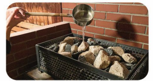
モール温泉でロウリュ「モールユ」

モールの独特な泉質はやみつきになりますね! まるで全身美容液に浸かっているように、お肌がツルスベになります。サウナブームも相まって最近では、若い方々も日帰り入浴される方が増えてきました! 日帰り入浴の受付はフロントにて承ります。皆様のお越しをお待ちしております!