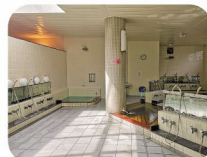
天窓から光が差し込む明るく 清潔な浴場