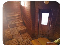
歴史を感じるサウナ室