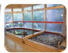
ジャグジー & 電気風呂