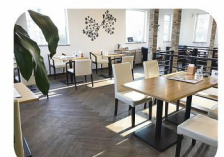
隣接するカフェ 「ヒカリキッチン」