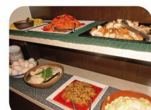
品数たっぷりの朝食バイキング